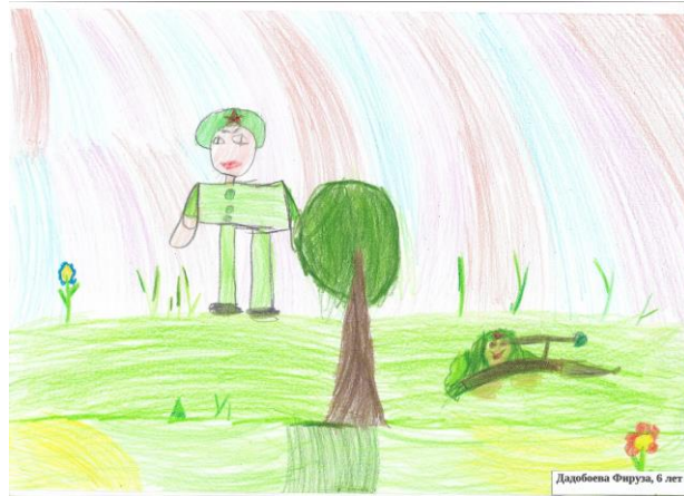
Дадобена Фируза, 6 лет